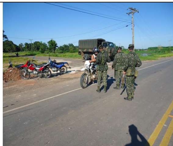
PBCE realizado na BR 364 próximo a Loc de MANOEL URBANO (Aç Rlz pelo 4º BIS).