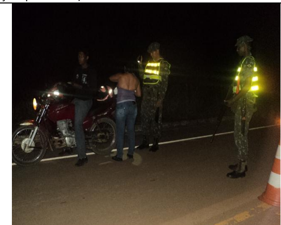
PBCE Rlz na Rv BR 364 próximo a Loc de FEIJÓ-AC (Aç Rlz pelo 4º BIS).